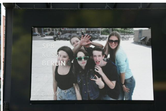
Рядом с Триумфальной колонной, «Золотая Эльза». Рекламный экран, для которого можно сделать фото.

Самое большое впечатление на меня произвело количество стрит-артов — уличных художеств: граффити, рекламных афиш, наклеек, рисунков, плакатов и многого другого. В какой бы глухой местности ты не находился, ты всегда найдёшь вокруг себя невообразимое обилие этих объектов.